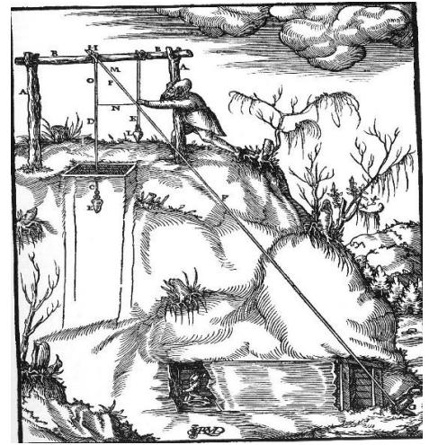
Traçage des puits et des galeries selon Agricola -1553-

Le droit pour respecter le bien des autres, et revendiquer ses droits et remplir ses devoirs envers autrui.